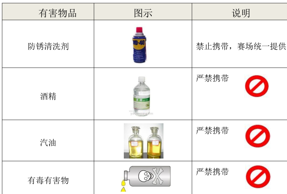
表 4 有毒有害物品