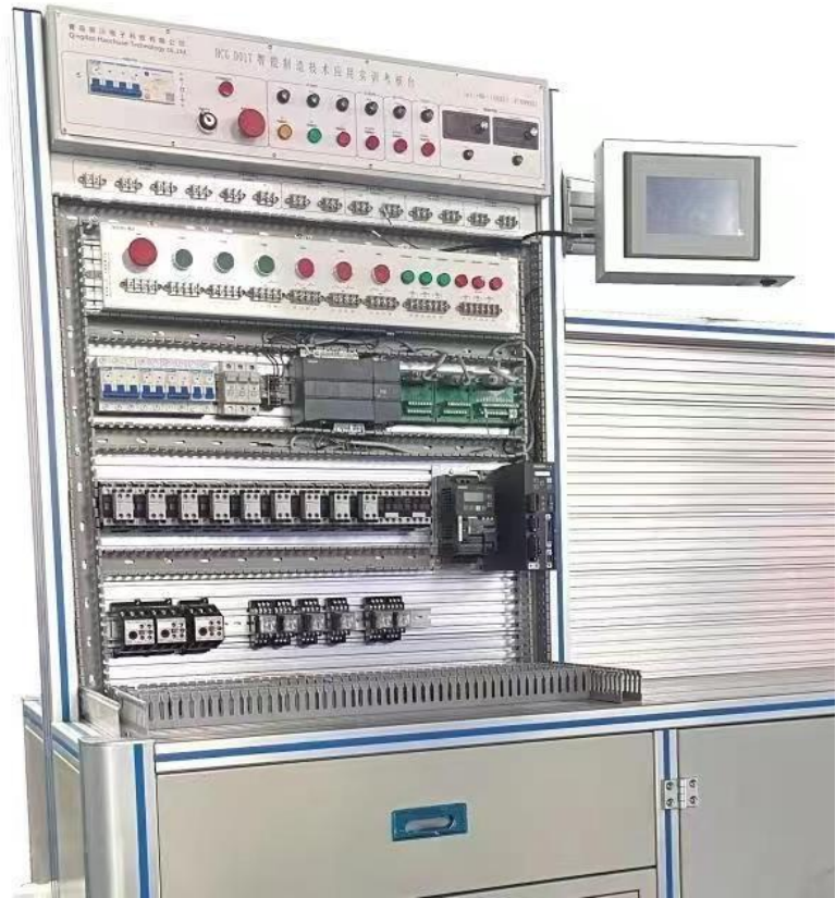
图 2 多功能智能制造竞赛设备实物图